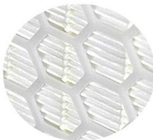
PARTICOLARE DEL SETTO FILTRANTE SPECIALE PER TURBOGAS

DIMENSIONI O VERSIONI DIVERSE SONO FORNIBILI A RICHIESTA VERSIONI CON 2 RETI (MOD. _TG/2) O 8 RETI (MOD. _TG/8) IN PLASTICA REALIZZABILI SU RICHIESTA